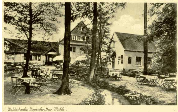
Waldschenke Diepeschrather Mühle