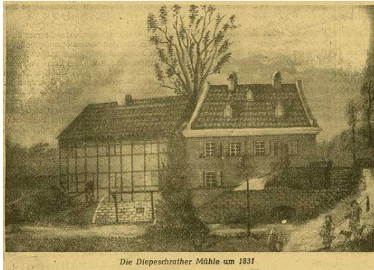
Die Diepeschrather Mühle um 1831